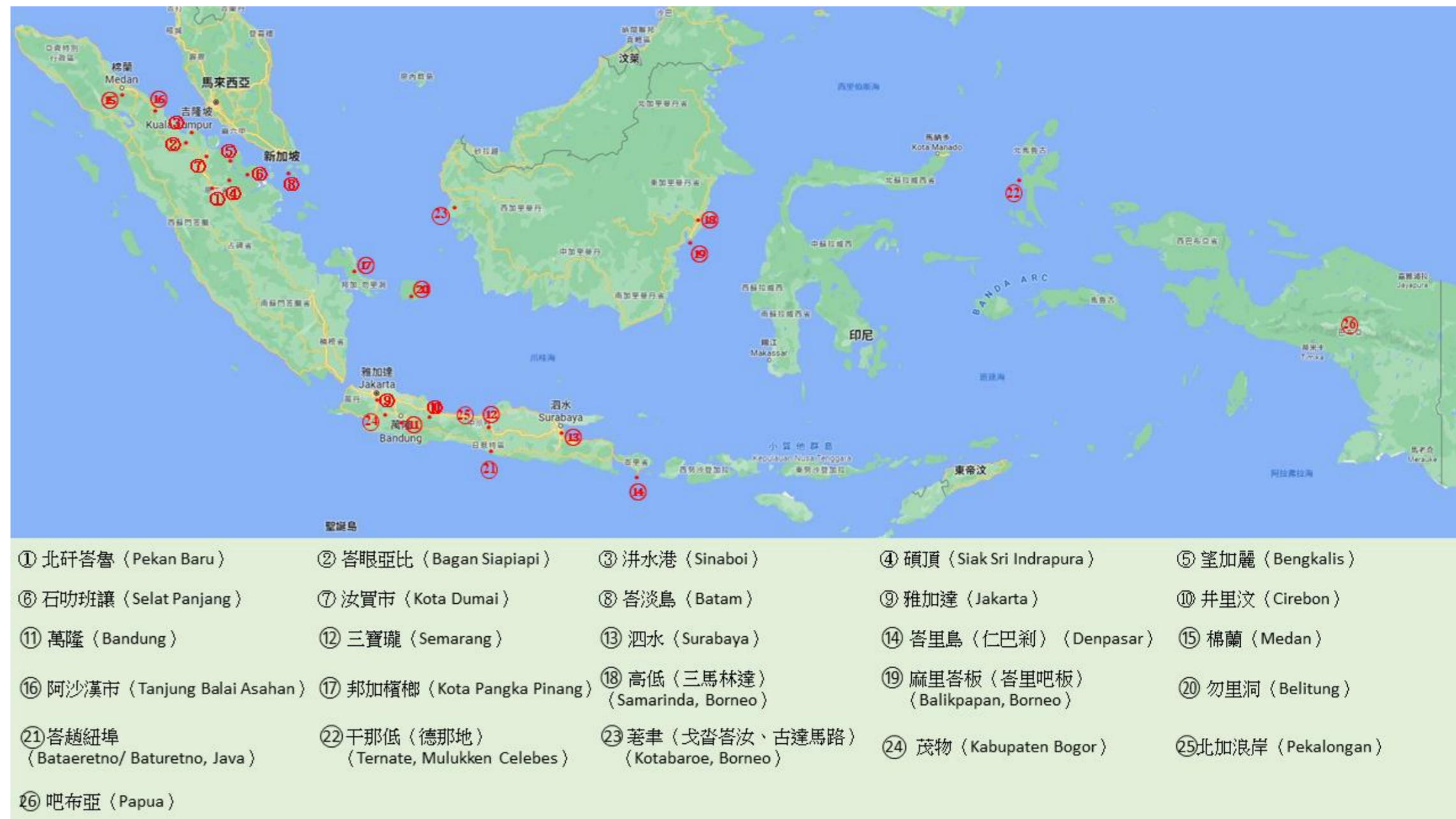
金門移民分布於印尼島嶼圖

同時，19世紀中葉以後，「新客」移民漸多。到了1930年代，爪哇的土生華人在華人總人口數中的比率已降至79%，在其他島嶼只有48%。華人在1930年代已經在印尼形成人口比率雖不高，但經濟實力雄厚的社群。以爪哇為例，據統計，1930年爪哇華僑人口總數中有116,517人是在荷印就外出生的，佔總數20%。福建人佔最大多數，將近38萬；其次為客家人，約7萬5千人；再則廣府人，約3萬9千人。