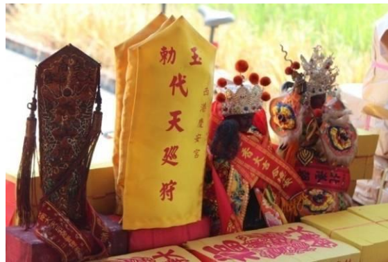
圖 9. 2014 年溪埔寮拜溪神坐鎮神明；由左至右為臺南大天后媽祖令牌、西港仔代天巡狩令牌、楊府太師、三太子(大太子)