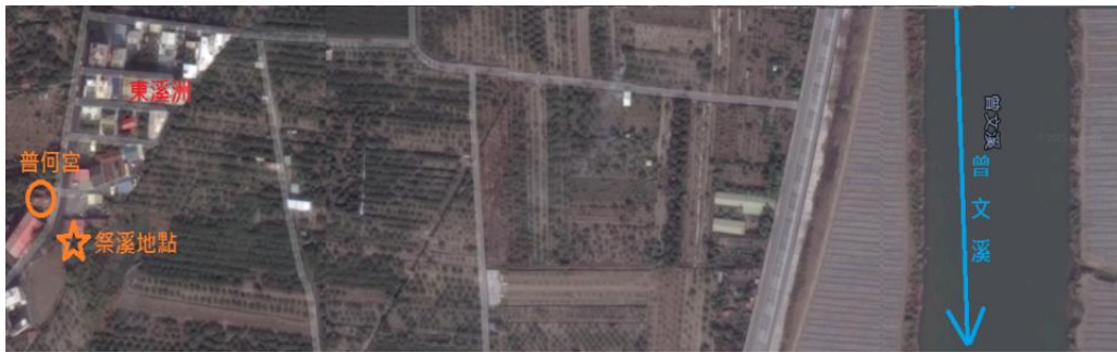
圖 2. 東溪洲祭溪過去地點