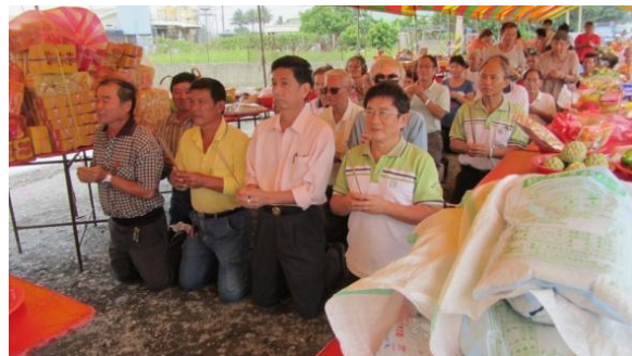
圖 13. 2013 年公親寮拜溪墘

挨戶於中午之前會先「拜門口」，之後約 13:00 到 13:30 開始陸陸續續挑著祭拜供品到拜溪墘地點「溪仔底」集合擺好供品(庄廟清水寺會先搭好棚架和桌子)，並恭請庄神清水祖師、南海佛祖 21 到祭拜現場坐鎮。原始祭拜位置在公親寮西北方舊河道內，也就是原本的「溪仔底」之地點，後來由於十幾年前馬路拓寬、原始祭拜地點狹窄等原因而遷移到現址，即公學路一段 124 巷過舊河道(曾文溪排水線)前方。