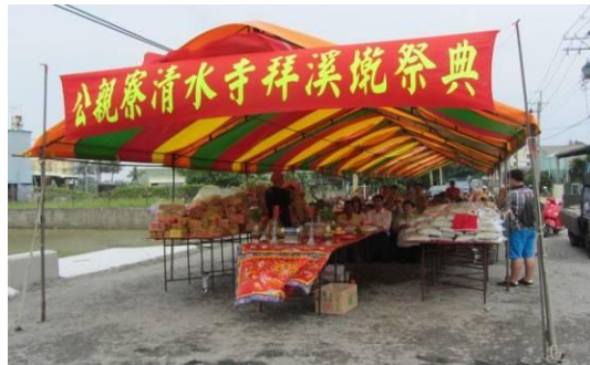
圖 12. 2013 年公親寮拜溪墘