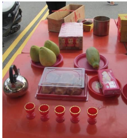
圖 10. 2013 年溪埔寮拜溪神；祭典中的麵豬、麵羊、麵雞

曾文溪堤防大路(圖 8)旁集合擺好供品(庄廟安溪宮會先搭好棚架和桌子)，廟方請來庄廟神明及西港仔代天巡狩(大、二、三千歲)令牌及臺南大天后媽祖令牌等神祇至祭拜現場坐