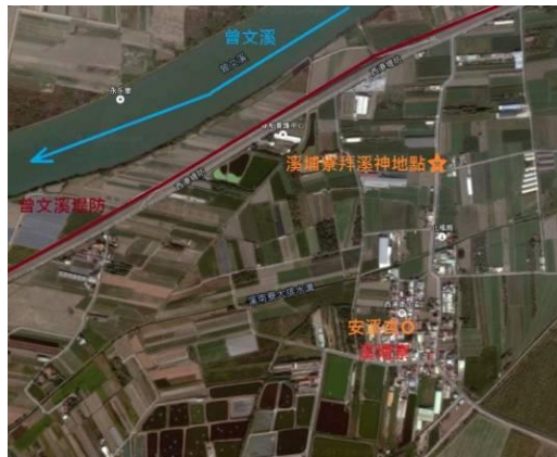
圖 8. 溪埔寮拜溪神地點