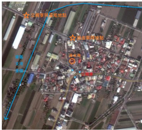
圖 11. 公親寮拜溪墘地點