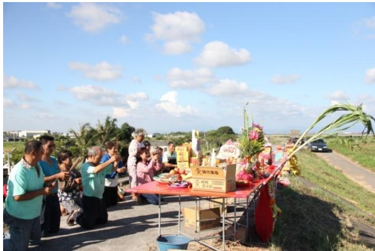
圖 3. 2015 年中港仔拜溪王；祭典設置於堤防上，面向曾文溪