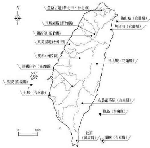
圖 1. 台灣知名生態旅遊地分布略圖

已出現社區共享的制度。期間公部門也一樣多有協助，例如雪霸國家公園基於敦親睦鄰，曾經補助步道的維修整建；教育部也經援電腦教室的構建，以使居民熟悉現代的科技；原民會近來也將其列為重點部落，協助當地在文化、生態、教育、觀光等全面性的提升(黃躍雯 2002, 蔡秀菊 2004)。部落就在自己的努力以及政府等外界的協助之下，目前居民對當地已有較高的認同，部份年輕人也願意留在部落效力，生態旅遊發展大致順遂(C1 當地長老 2010.3.12 受訪)。