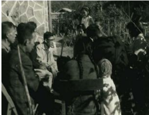
圖 4. 居民做禮拜的照片