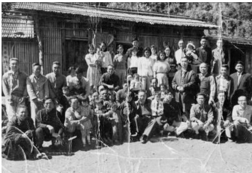
圖 2. 經國先生與當地居民合影留念