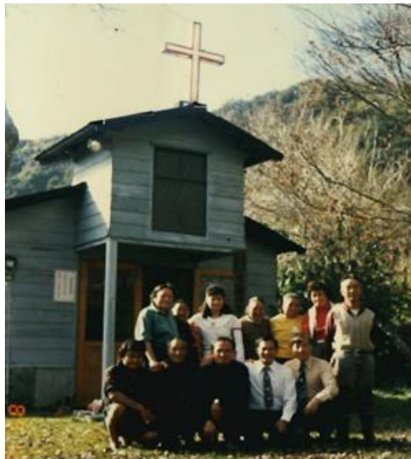
圖 5. 當地居民與教堂合影