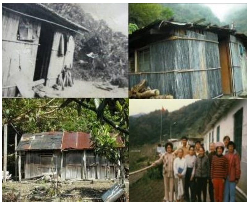
圖 3. 薛家場竹屋 (左上)、F3 西寶鐵皮木板屋 (右上)、原住民檜木屋 (左下)、M9 居住的水泥屋 (右下)

生活息息相關的場域。此外，還有一個鄰近地區的遊憩景點「文山溫泉」，天祥及西寶受訪居民們時提到此地尚未正式成為國家公園境內之遊憩景點前，即是居民平日休閒場域。