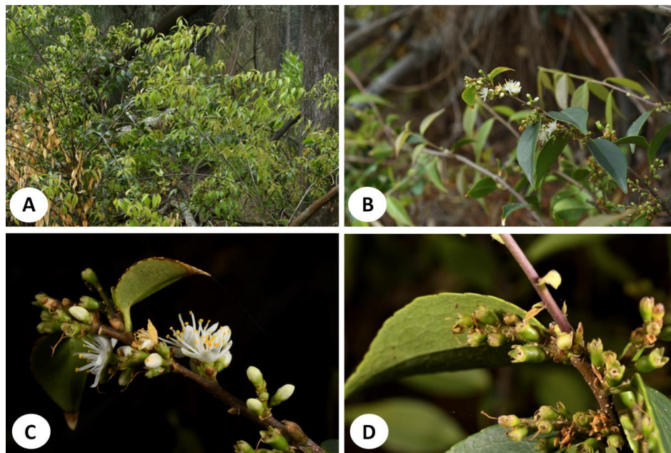
圖 1.金門新紀錄植物-尾葉灰木( Symplocos caudata Wall. ex G. Don)生態及形態照 A. 常綠灌木；B. 葉；C. 花；D. 幼果