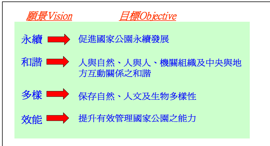
圖 2 國家公園發展願景與目標

依循上述發展願景及目標，賡續針對國家公園經營管理不同面向訂定政策，以求更確切地達成國家公園整體發展願景，包括：